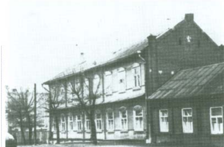
Здание, в котором располагался юденрат

С образованием гетто в нашем жилом районе вскоре начало действовать так называемое самоуправление - юденрат. В приказе военного коменданта это учреждение называлось „Жыдоуская Рада“. Расположили „раду“ в двухэтажном здании на углу улиц Крымской и Ратомской, напротив Юбилейного базара, где до войны находилось 4-е отделение милиции.