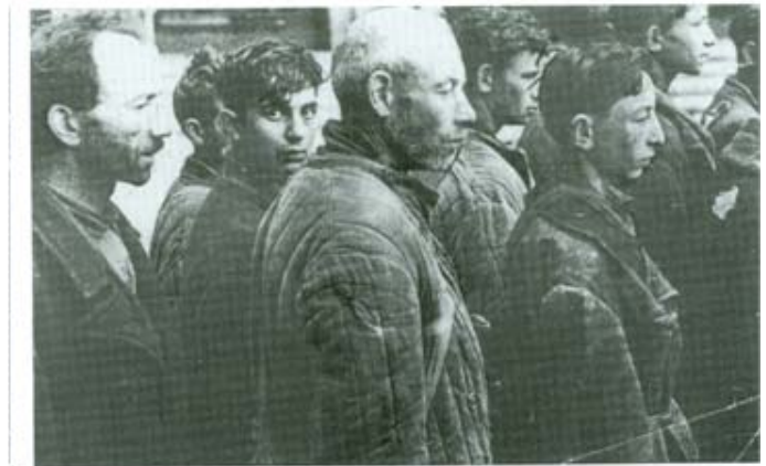
Колонна рабочих-евреев в минском гетто

Сама биржа труда разместилась в деревянном доме на углу Ратомской и Танковой, напротив сквера. Вход был с торца. Это рядом с пекарней и недалеко от юденрата. Там всегда толпились люди, потому что в