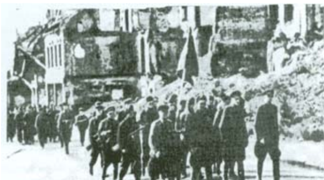
Партизанский парад в Минске, после освобождения

- До завтрашнего дня, чтобы вашей ноги здесь не было. Понятно? - сестра сначала говорила спокойно, а потом перешла на крик: - Мы воевали, а вы наживались! Вон из нашего дома! Если добром не