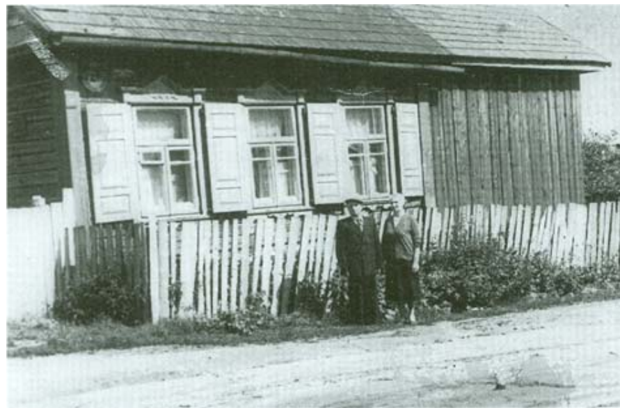
Дом, в котором мы жили перед войной по Зеленому переулку № 21, рядом папа и мама.

Запомнилось, как мама нас по очереди купала возле печки, потому что в общей комнате всегда было прохладно. Только, кажется, в тридцать девятом году, папа настелил в доме пол. Как мы, дети, радовались! Сразу в доме стало уютнее и теплее.