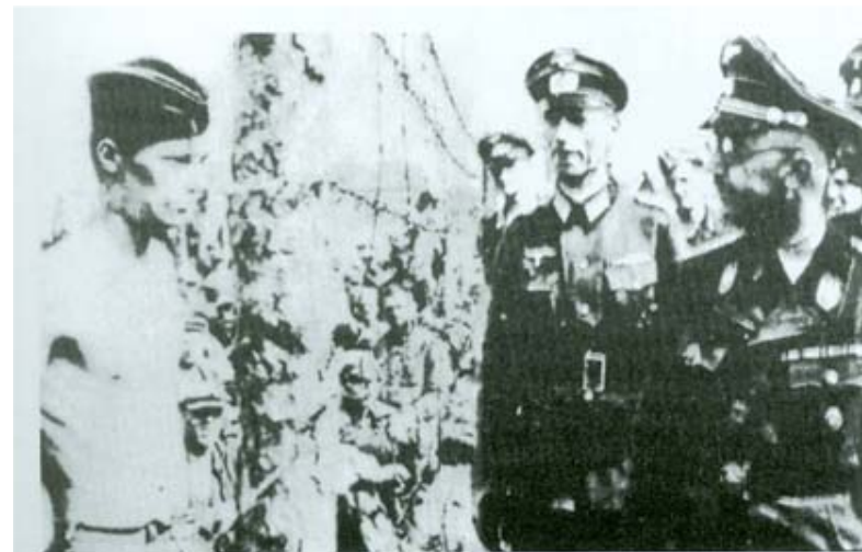
Рейхсфюрер СС Гиммлер в Минске. Его сопровождают генералы и Адольф Эйхман.

Вначале на видных местах появились грозные предупреждения военного коменданта о репрессиях за совершение актов саботажа. Потом приказ об образовании гетто (полный текст см. на стр.45 ) - 12 пунктов в этом категорическом приказе и все о том, как сделать нашу жизнь невыносимой. Жителям города - евреям надлежало переселиться на опреде-