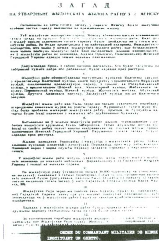
Приказ об образовании гетто в Минске (на белорусском языке). Внизу - немецкий штамп.