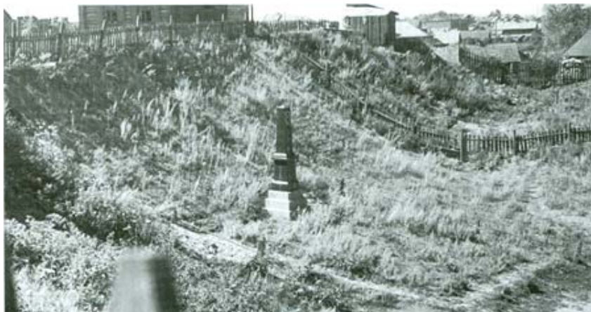
Яма. Так называли евреи место погребения тысяч людей в Минске. Здесь установлен небольшой памятник.

И снова немцам пришлось привести туда полицейскую команду, чтобы зарыть могилу землей.